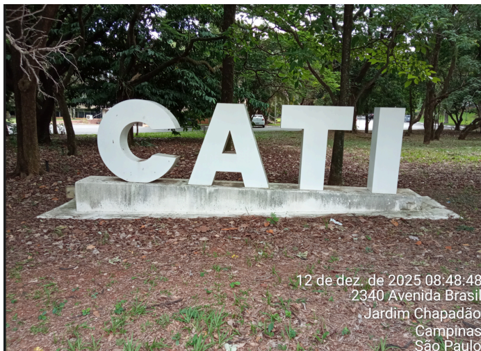
foto: produtor/propriedade, evento ou serviço realizado, data da foto.